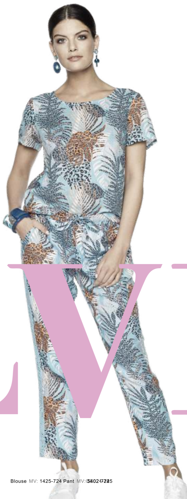
Blouse MV: 1425-724 Pant MV: 540247225