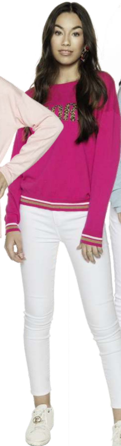
Sweater MV: 2504-200