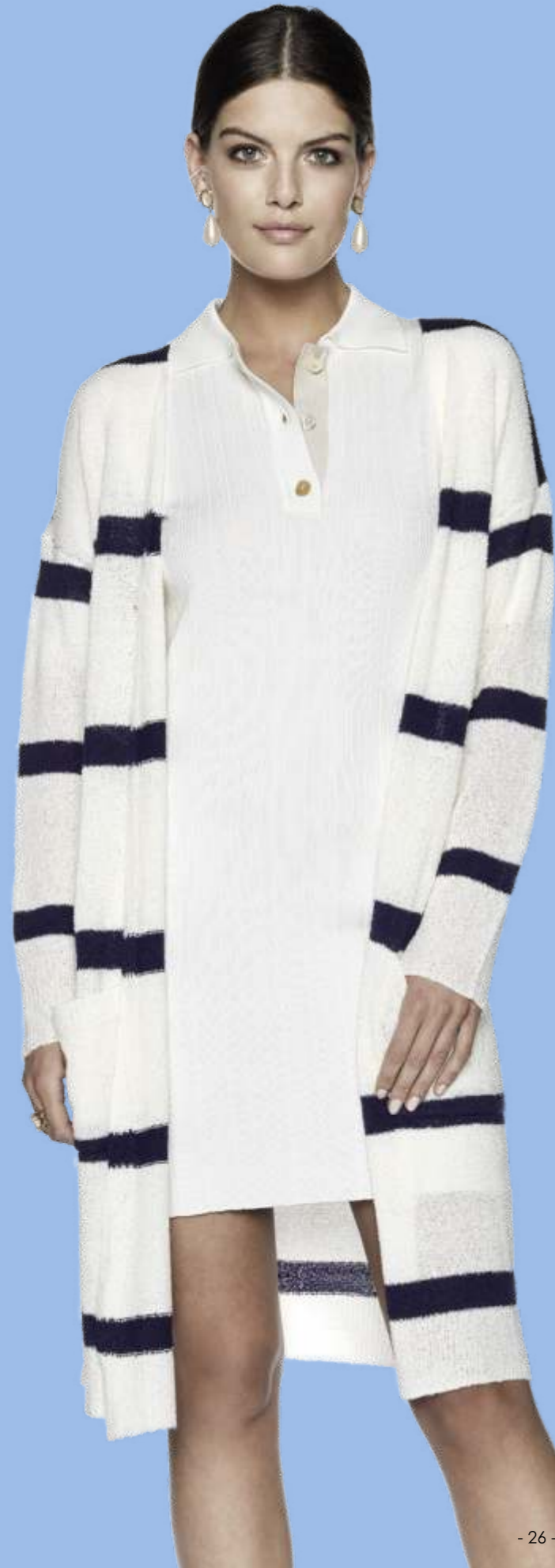
Dress MV: 2968-338