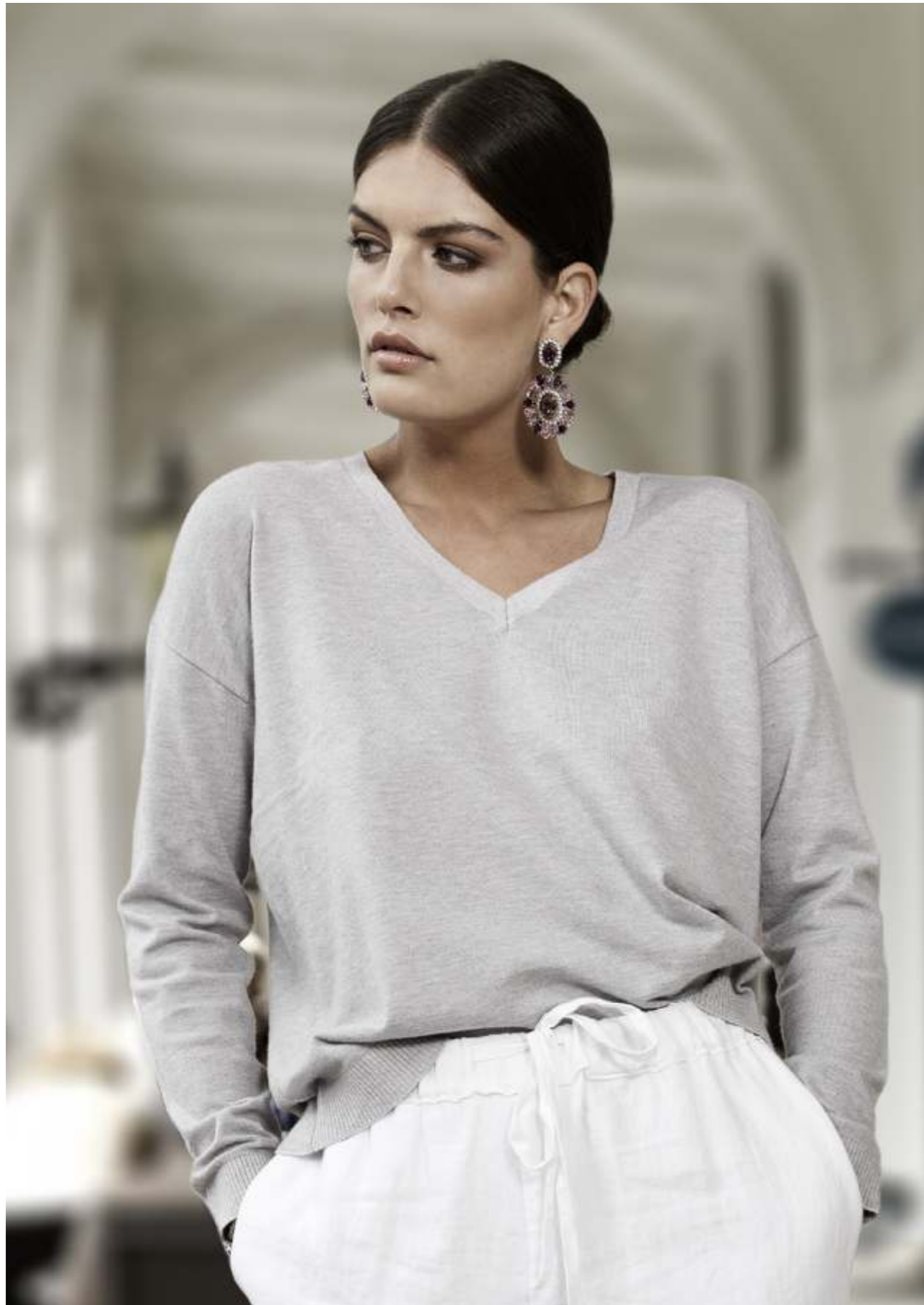
Sweater MV: 2531-212 OE: 25311-213 Pant MV: 505045689