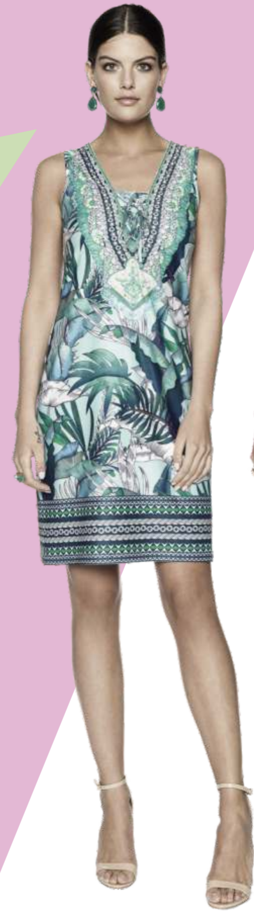
Dress MV: 8929-12 OE: 89291-13