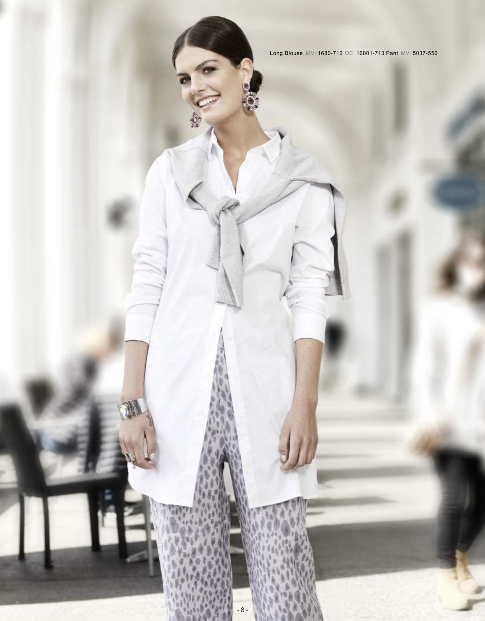
Long Blouse MV: 1680-712 OE: 16801-713 Pant MV: 5037-550