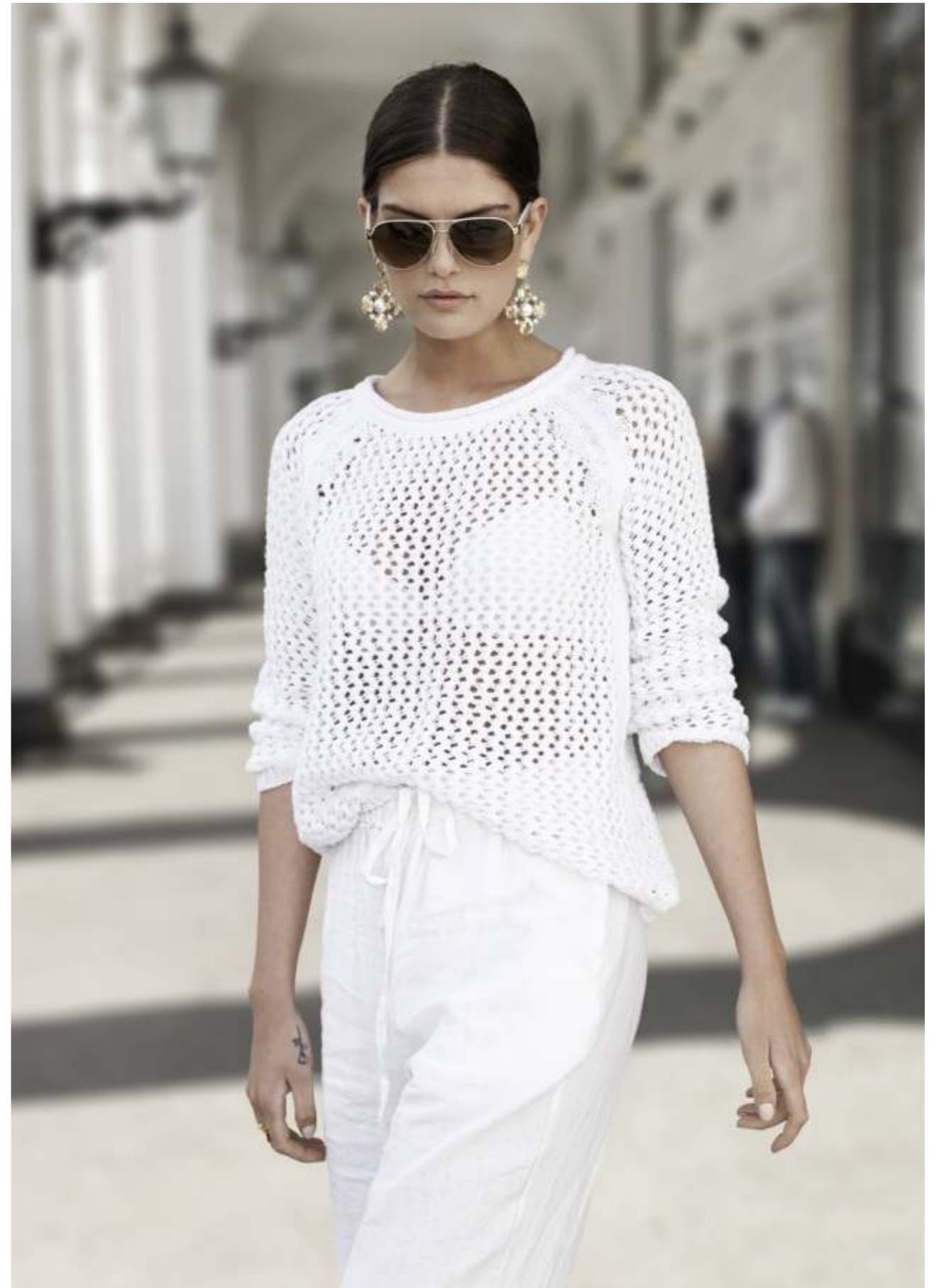
Sweater MV: 2524-396 Pant MV: 505045689