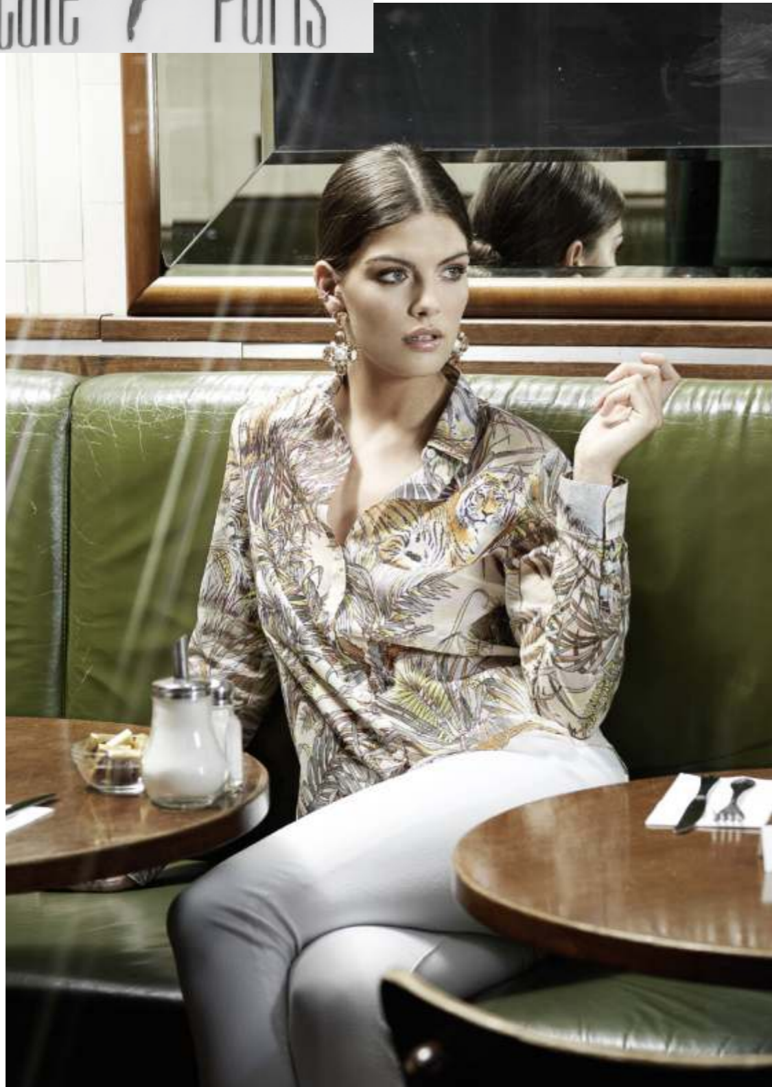
Blouse MV:1832-154 OE 18321-155 Pant MV:501141701