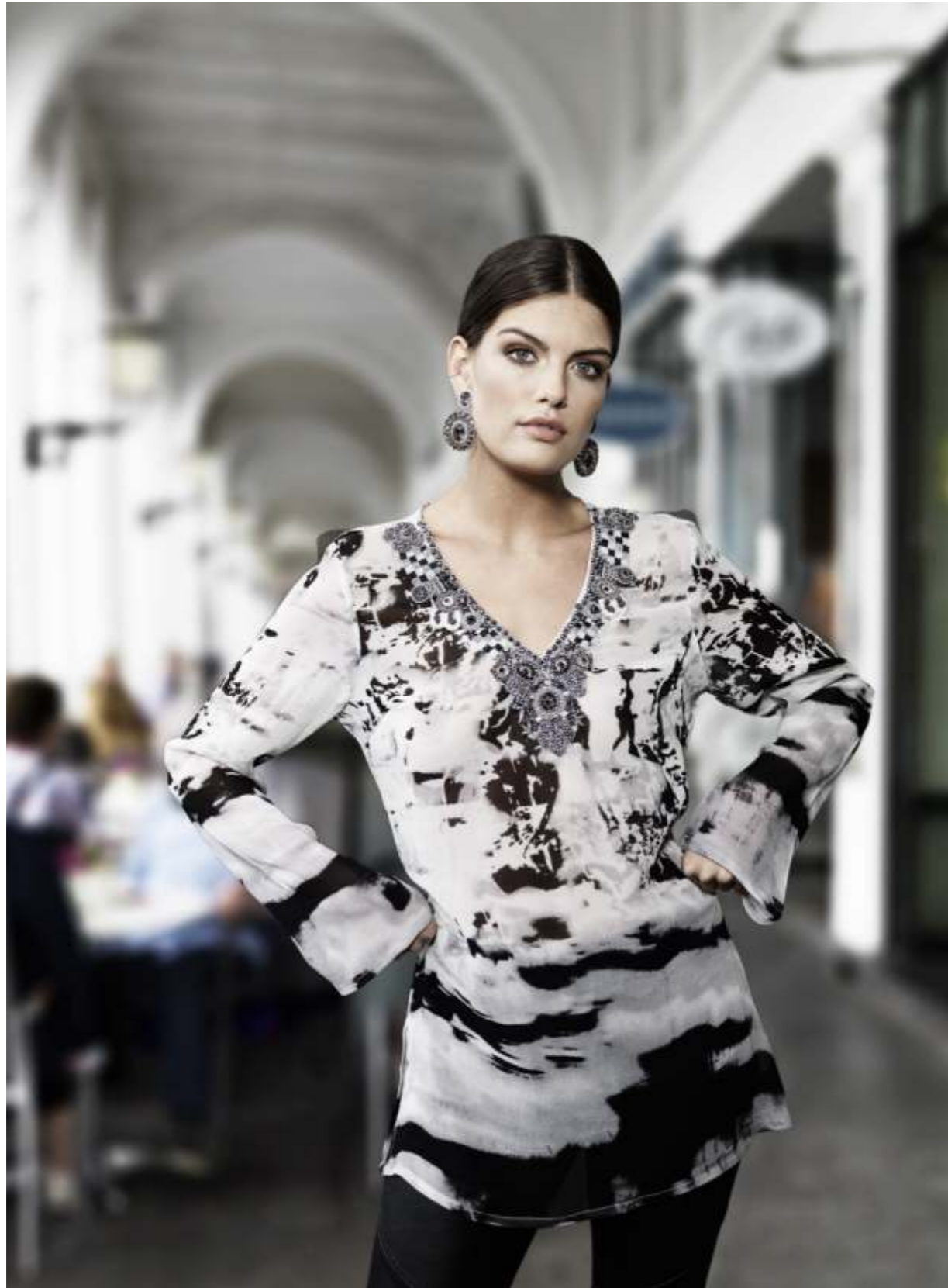
Tunic MV: 1641-182 OE: 16411-183 Leather-Pant MV: 5012-540