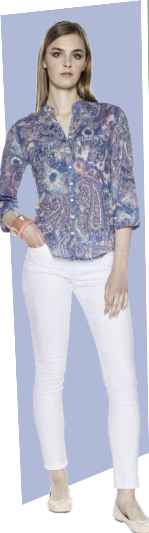
Pant this side. MV: 5011-170 OE: 50111-171