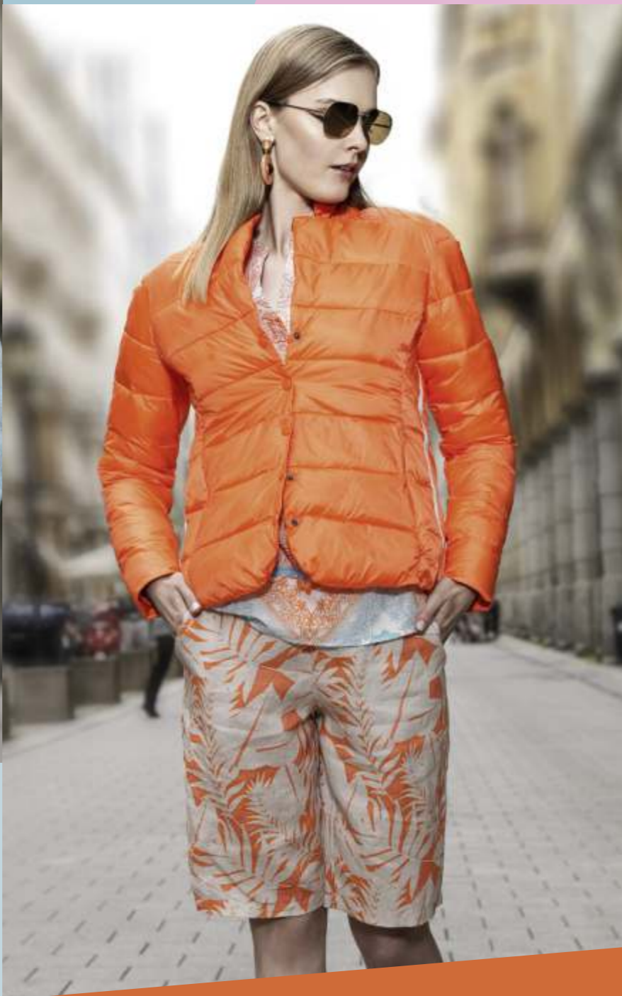
Jacket MV: 7871-770 OE: 78711-771 Blouse MV: 180547167 Pant MV: 5605-554