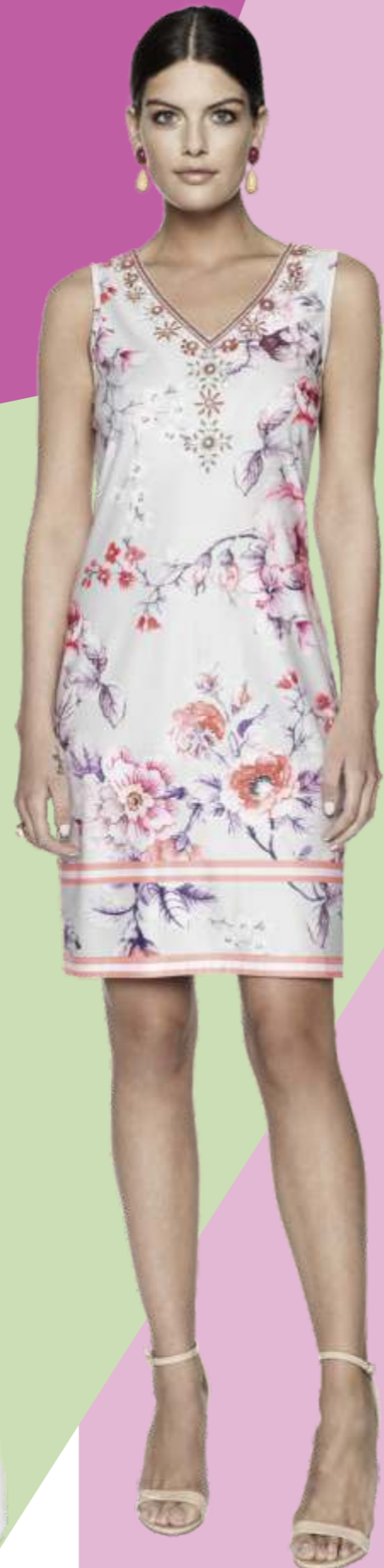
Dress MV: 8928-12 OE: 89281-13