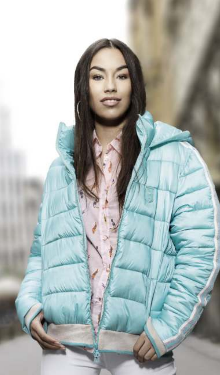
Jacket MV: 7212-770 OE: 72121-771