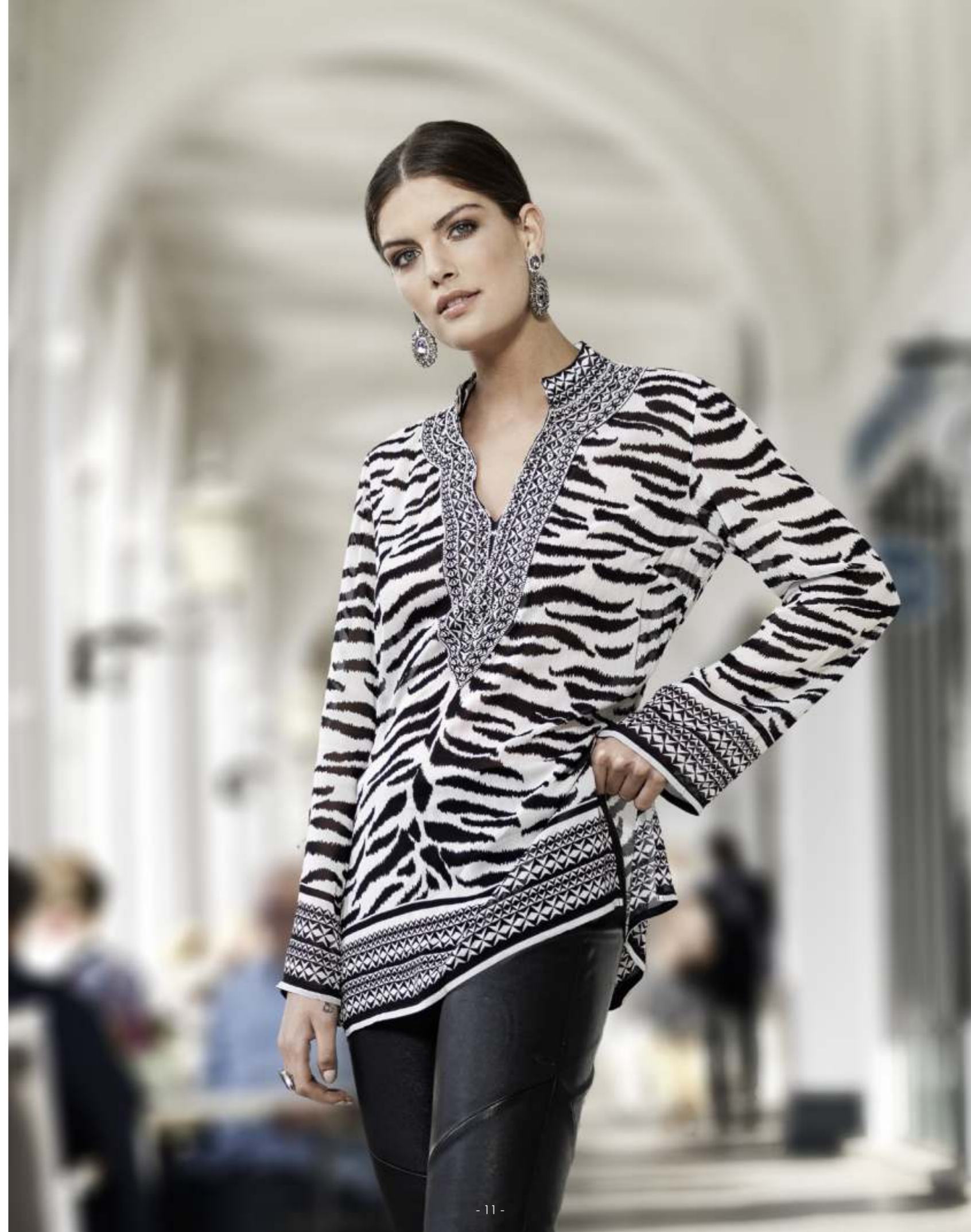
Rechte Seite: Tunic MV: 1685-18 OE: 16851-19 Leather-Pant MV: 5012-540