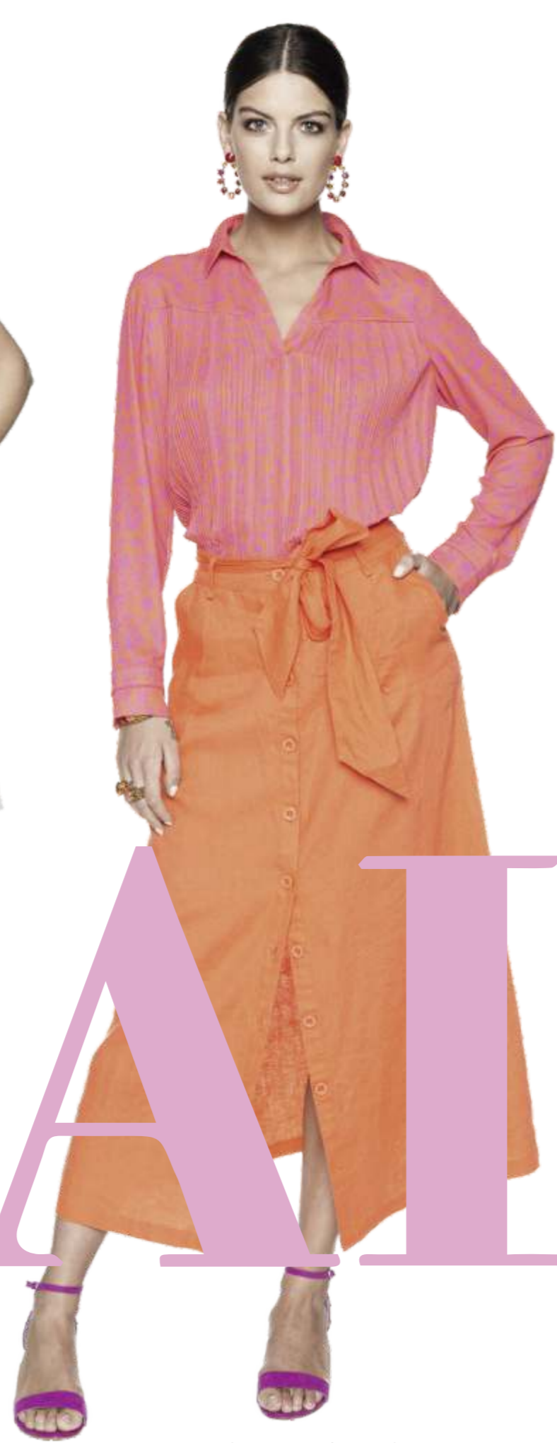
Blouse MV: 1624-640 OE: 16241-641 Skirt MV: 408945689