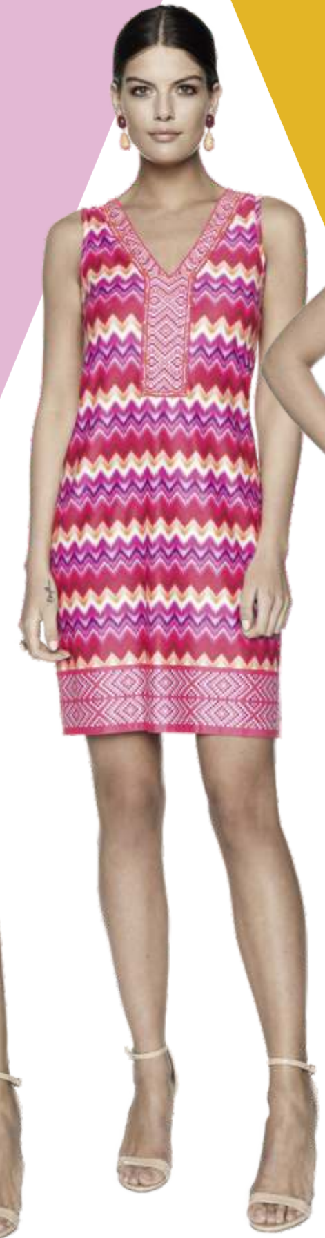
Dress MV: 8927-12